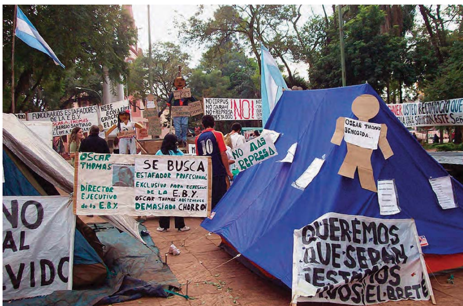
Diferentes movimientos sociales protestan por la falta de trabajo y de vivienda causada por la Represa de Itaipú. Plaza 9 de Julio, Posadas, Misiones. Foto: GM, 2007.