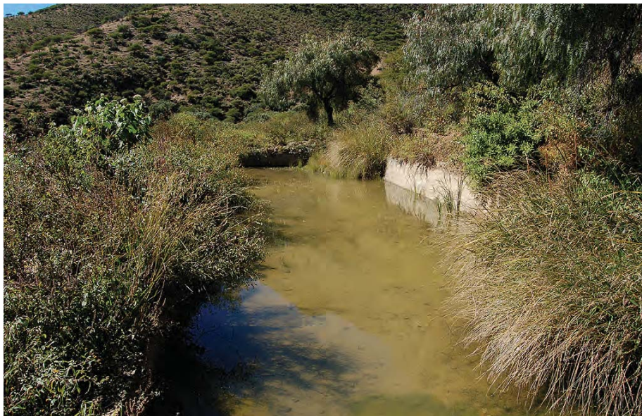
Comunidad campesina de Ladera Norte, cerca de Tarija, Bolivia. Un ejemplo de los varios contenedores de agua de vertiente para riego y consumo. Foto: Douglas Mansour, 2006.