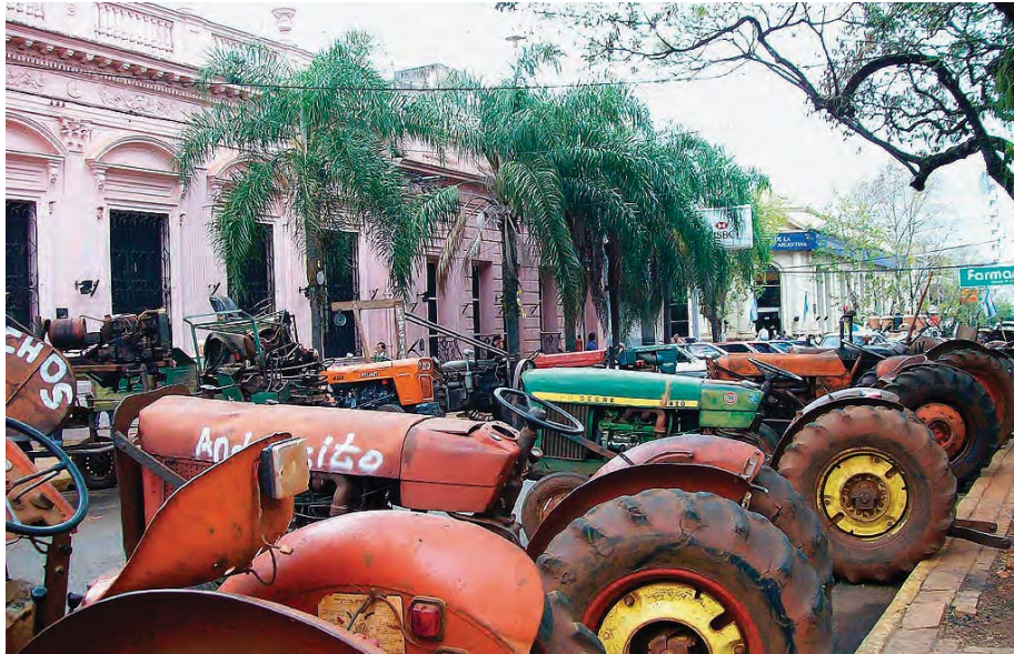
Los productores yerbateros acamparon más de 100 días frente a la Intendencia de Posadas en reclamo de un precio justo para la yerba mate y de la creación del Mercado Consignatario. Plaza 9 de Julio, Posadas, Misiones. Foto: GM, 2007.