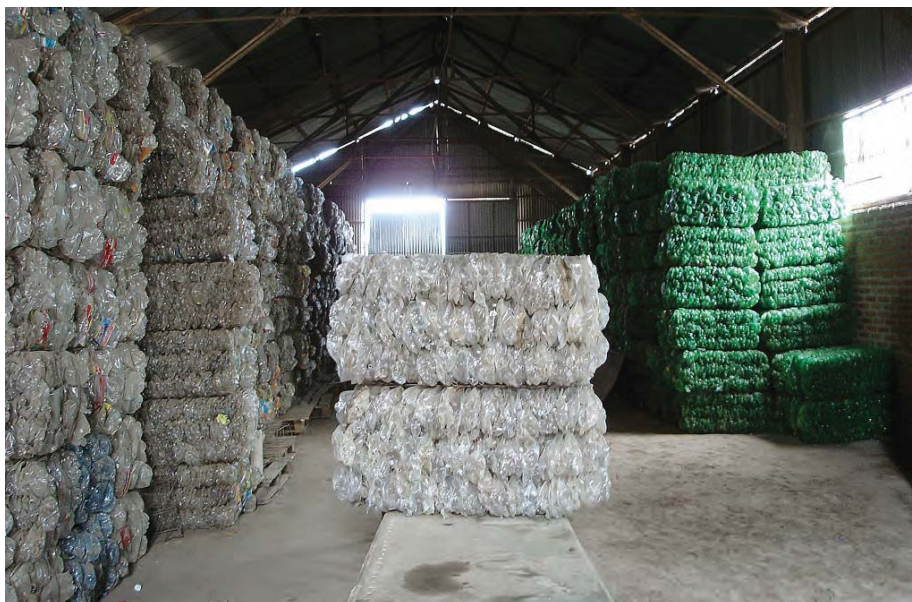
Basurero ecológico y compactadora de plásticos. Emprendimiento productivo de la UTD de Mosconi. Salta. Foto: Sol Arrese, 2005.