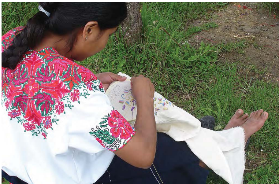
Artesana zapatista de la Cooperativa de mujeres artesanas Xulum Chon en Oventic, Chiapas (México).