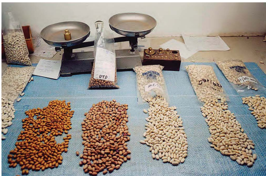
Seleccionadora de porotos. Emprendimiento productivo de la UTD de Mosconi. Salta. 2005.