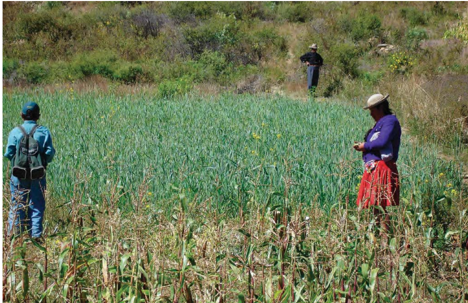
Comunidad que se dedica a la agricultura en pequeña escala para consumo propio y venta, en Tarija (Bolivia).