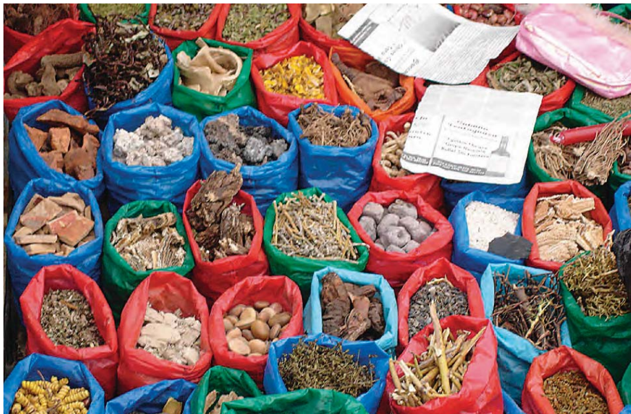
Mercado de Tarija, variedad de legumbres en una economía no formalizada (Bolivia)