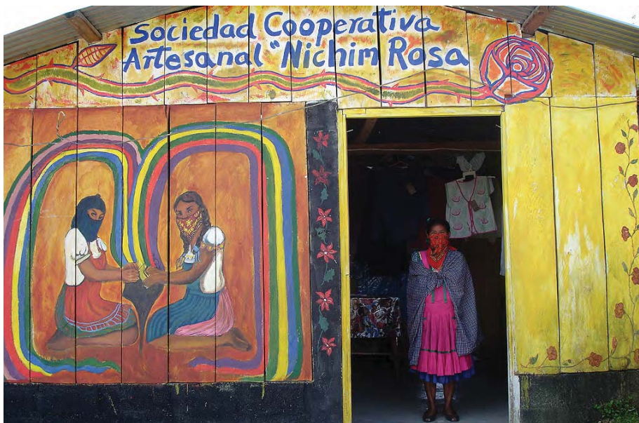
Cooperativa de mujeres artesanas "Nichim Rosa" en el caracol zapatista de Oventic "Resistencia y rebeldía por la humanidad", Chiapas (México). Foto: Luciana García Guerreiro, 2007.