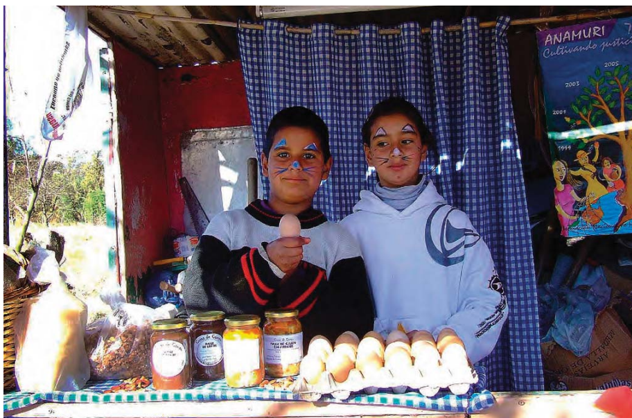
Cooperativa de Trabajadores Rurales de San Vicente, del Frente Popular Darío Santillán, Buenos Aires.