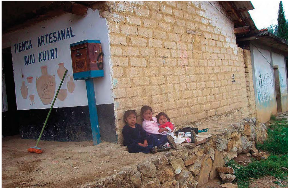
La comunidad de Cuquila vive de la agricultura en pequeña escala y de la artesanía. Tlaxiaco (México).