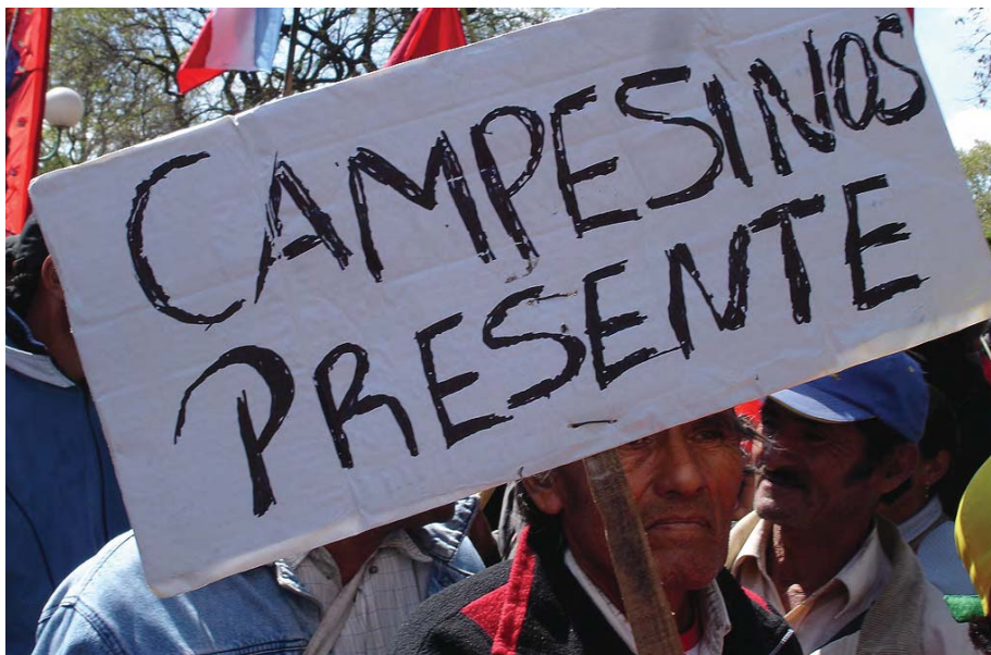
Marcha por la vida, contra el saqueo y la contaminación, Buenos Aires. Foto: Martin Halliburton, 2007.