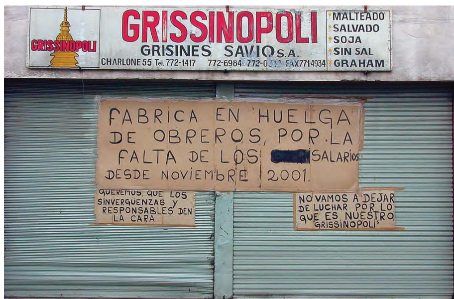
Entrada de la fábrica de grisines y panificados Grissinópolis, recuperada por sus trabajadores, Buenos Aires. Foto: Juan Biderman, 2002.