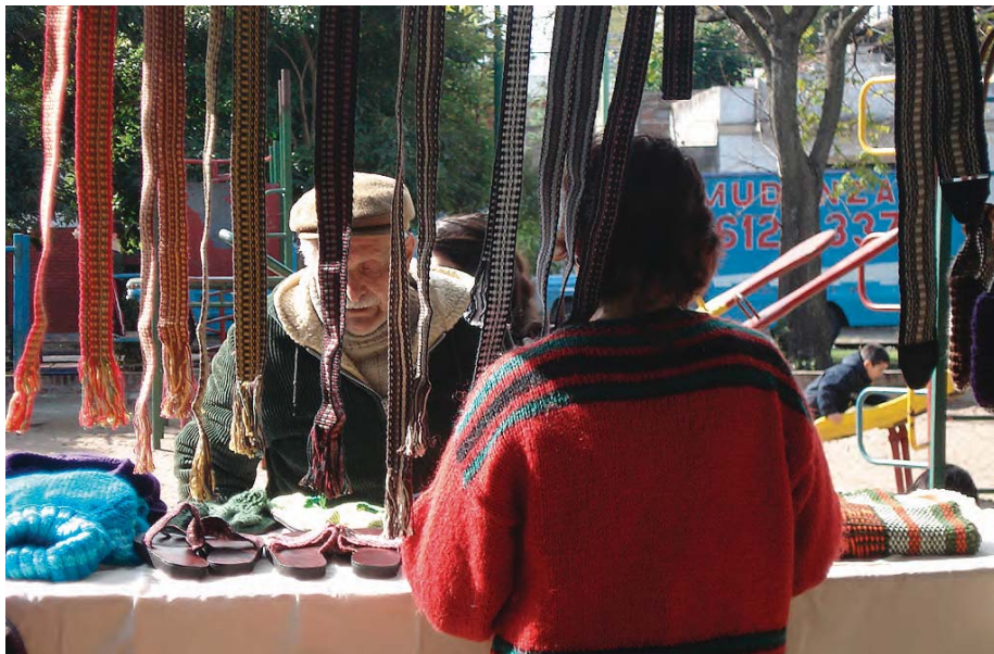
Feria de productos de la Red de Economía Solidaria Tacurú y de la Red de Emprendimientos del Bajo Flores, Buenos Aires.