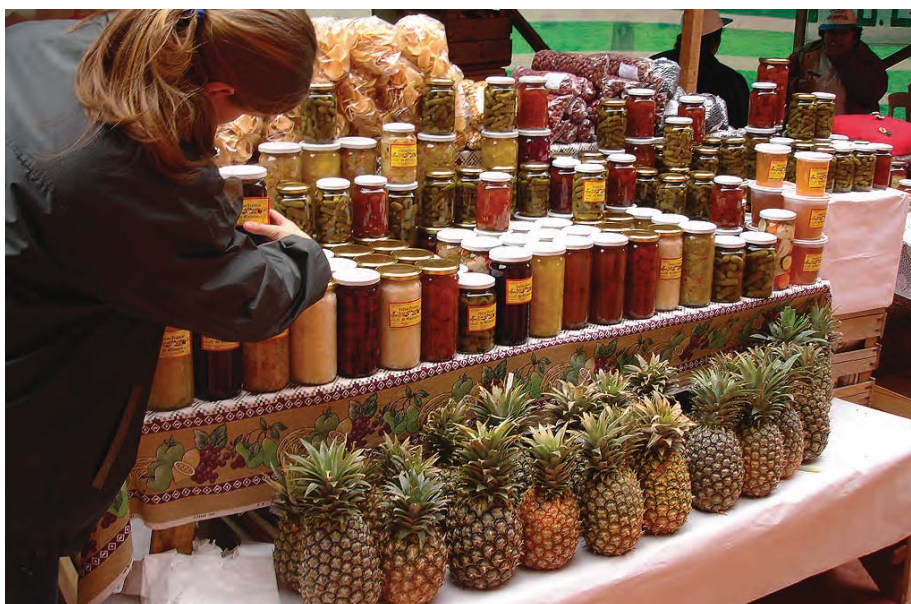
Feriante en la 9ª Fiesta Provincial de las Ferias Francas en Posadas, Misiones.